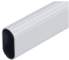
TOA.1530.3.10.WHM белая (покраска) 15x30x1