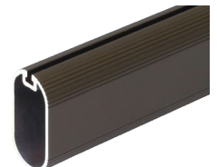
TOAD.1530.300.26P бронза (анодировка) 15x30x1