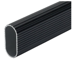
TOA.1530.3.10.BLM черная (покраска) 15x30x1