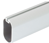
TOAD.1530.300.21P алюминий (анодировка) 15x30x1