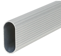
TOA.1530.3.10.31P алюминий (анодировка) 15x30x1