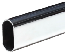
TOS.1530.3.10.CP хром глянец 15x30x1