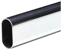
TOS.1530.3.07.CP хром глянец 15x30x0,7