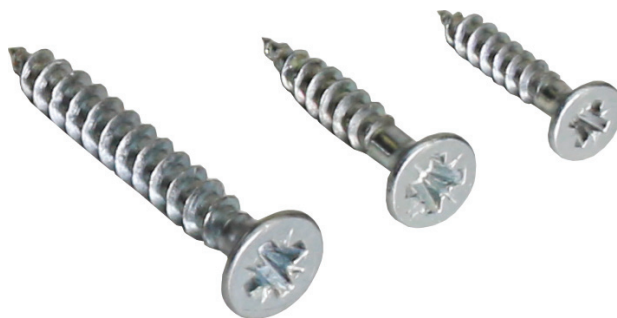
шуруп-саморез головка потай-прямая