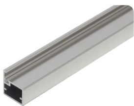
SL-PP алюминий полированный (анодировка)