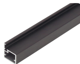
BL-BA черный шлифованный (анодировка)