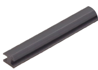
арт. GP.M01.4,5.BL уплотнитель для профилей FP.10 и FP.11, цвет черный, в бухтах