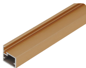
GT-BA золото шлифованное (анодировка)