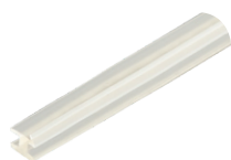
арт. GP.M01.4,5.LM уплотнитель для профилей FP.10 и FP.11, цвет прозрачный, в бухтах