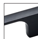
...76 черный шлифованный