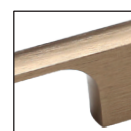
...31 золото шлифованное