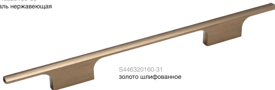
S446320160-31 золото шлифованное