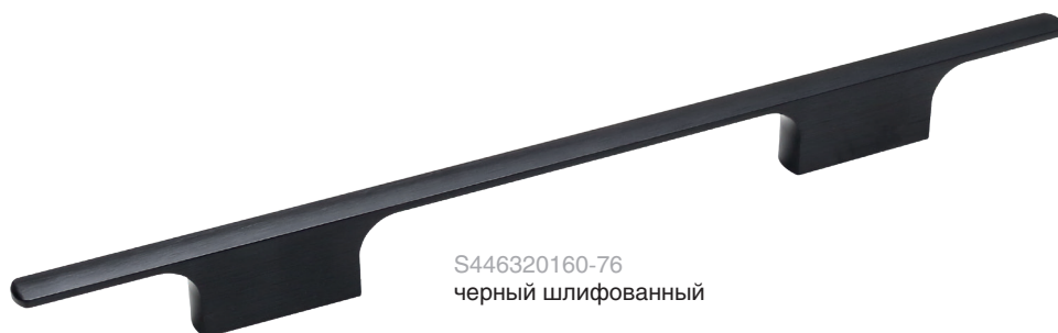
S446320160-76 черный шлифованный