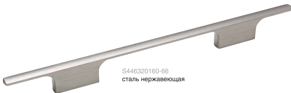
S446320160-66 сталь нержавеющая