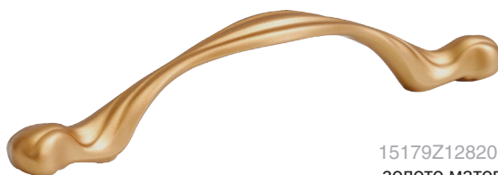
15179Z12820.46 ЗОЛОТО МАТОВОЕ

Предложение действительно пока товар есть в наличии на складе. Дополнительные скидки и скидка клиентов на данный товар не действуют.