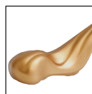
...46 золото матовое