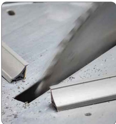
1. Обрезать по размеру.