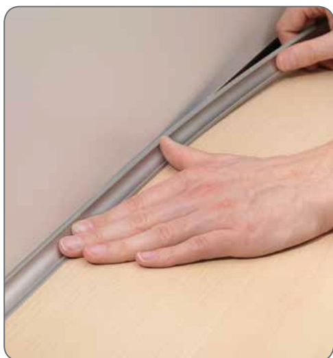
5. Зафиксировать верхнюю часть.