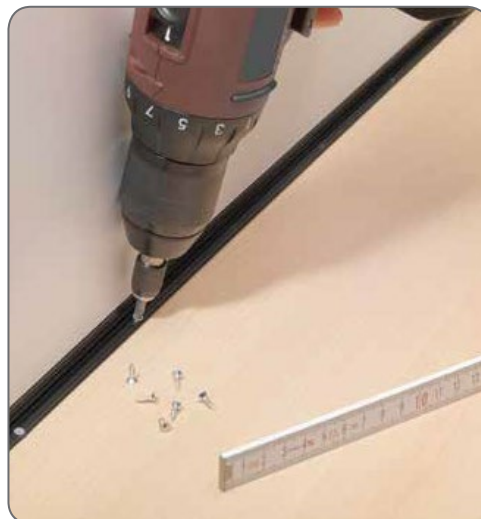
4. Закрепить шурупами. (шурупы с потайной головкой 2,5 x 10)