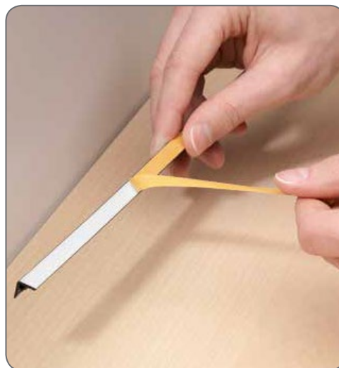
2. Обрезать по размеру.