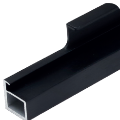
профили серии FP.20FH