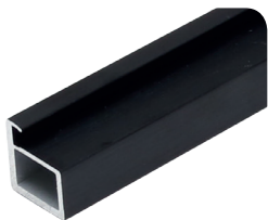
профили серии FP.20P