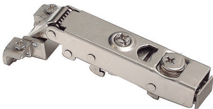
Схема привода замка накладной петли для узкого алюминиевого профиля шириной 20-21 мм

https://makmart.ru/catalog/hinges/mb2/clipon/553274/