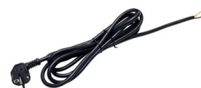
ПВС-ВПС22 3*1,5 3,0ч шнур ПВС-ВП 3*1,5 S22, черный, 3000 мм