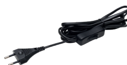
EM.WS.2*0,5.3000.W.B провод сетевой 3000 мм., с вилкой Europlug и проходным выкл. черн.