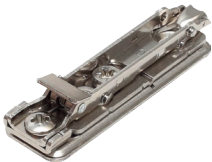
арт. ВАР3М09 клип-ответная планка H0 под шуруп, прямоугольная