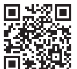
арт. ВАVGM49F/16 клип-ответная планка H4 с евровинтом, крестообразная