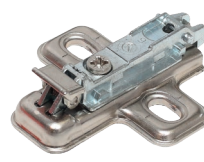
арт. ВАV3М09F клип-ответная планка H0 под шуруп, крестообразная