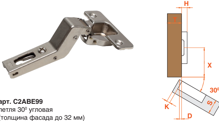
арт. C2ABE99 петля 30° угловая (толщина фасада до 32 мм)