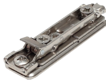
арт. ВАРGM09/16 клип-ответная планка H0 с евровинтом, прямоугольная