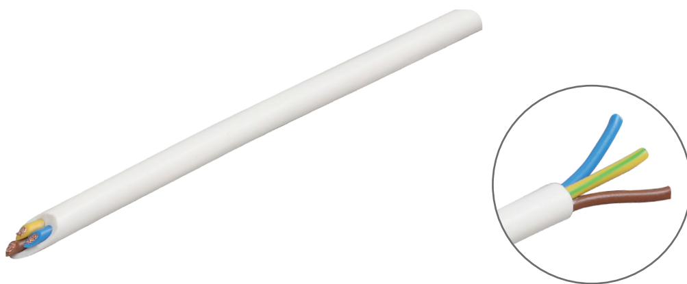
провод ПВС 3*0,75, белый, (100М)